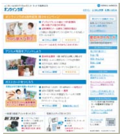
「オンラインラボbyコニカミノルタ」 URL: http://onlinelab.jp/

デジタルカメラの普及により、個人の撮影データが飛躍的に増えつつある昨今、写真の分野において新たなサービスが求められている。コニカミノルタグループが4年前から個人ユーザーに向けて提供しているインターネットを使った「オンラインラボbyコニカミノルタ」は、個人が写真の様々な楽しさを満喫できるサービス。増大化するデータ量に対応する高い信頼性と拡張性にすぐれたシステムが不可欠とされる中、同社が選択したのがアイシロン社のインテリジェント・クラスタ・ストレージシステム「Isilon IQシリーズ」だった。