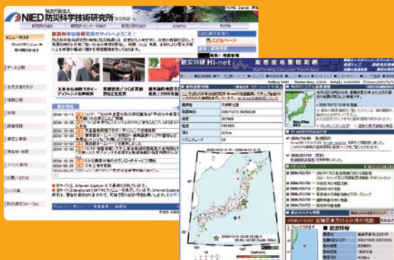
「独立行政法人防災科学技術研究所」サイト